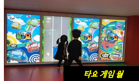
타오 게임 월