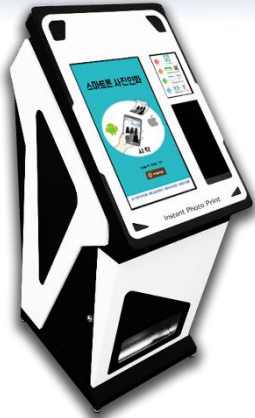
스마트폰 사진인화 자판기