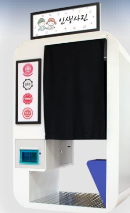
네트 인생샷 포토부스