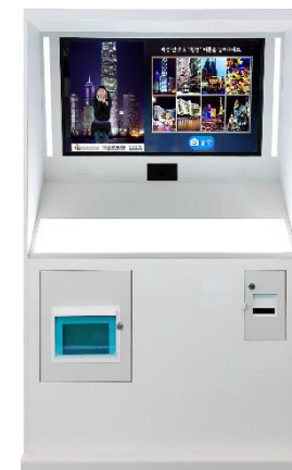
43" 크로마키 키오스크