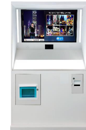
43" 크로마키 키오스크