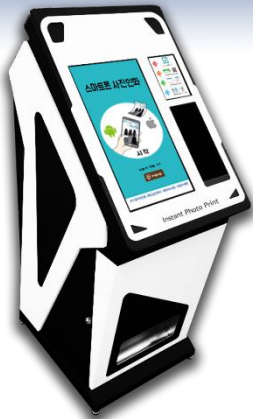
스마트폰 사진인화 자판기