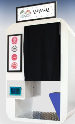
넷 인생샷 포토부스