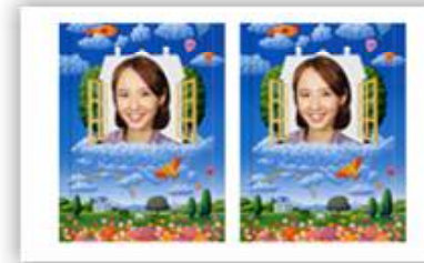
배경합성 2분할 인화지 크기 10.6cm × 15.2cm