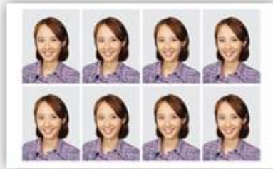
3.5cm × 4.5cm 8장 주민증, 운전면허증, 여권사진 등