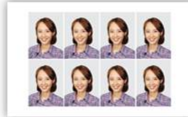
3cm × 4cm 8장 소형 증명사진