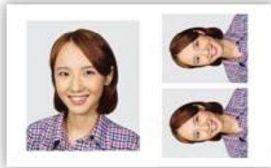
6×7cm 1장 + 4.5×5.5cm 2장 명함판 사진