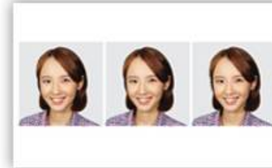
5cm × 5cm 3장 비자 등