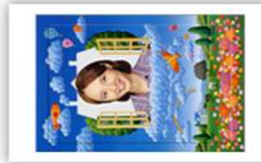
배경합성 인화지 크기 10.6cm × 15.2cm