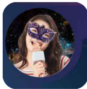
촬영된 최신사진 유저 프로필사진에 반영