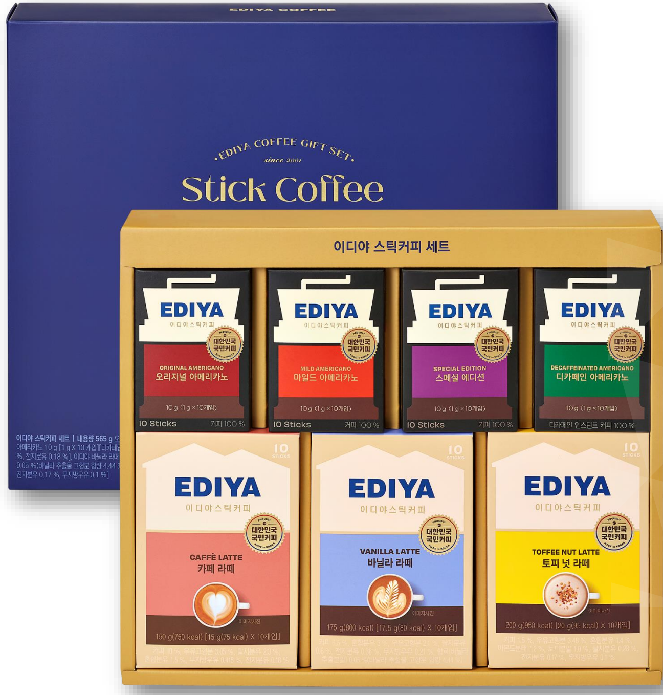
이디야스틱커피 세트 23,000