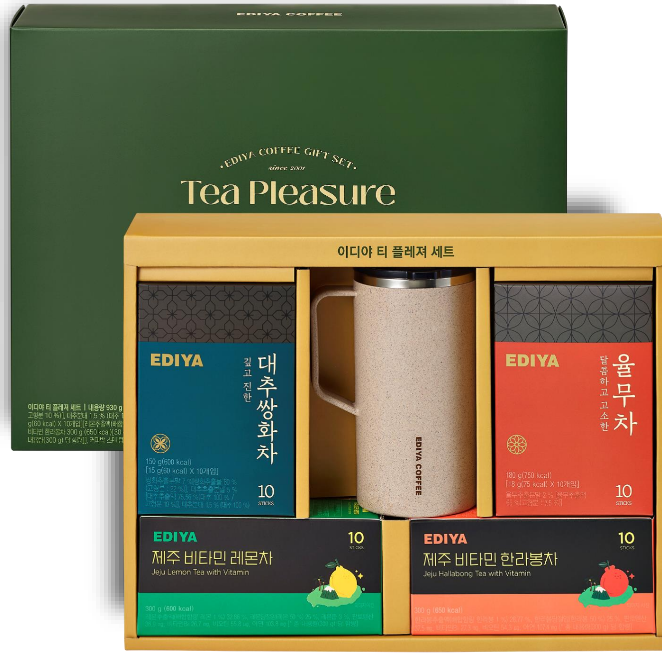
이디야티플레저 세트 33,000

전통차(10T) 2종 액상 과일차(10T) 2종 커피박 텀블러(600ml) 1개