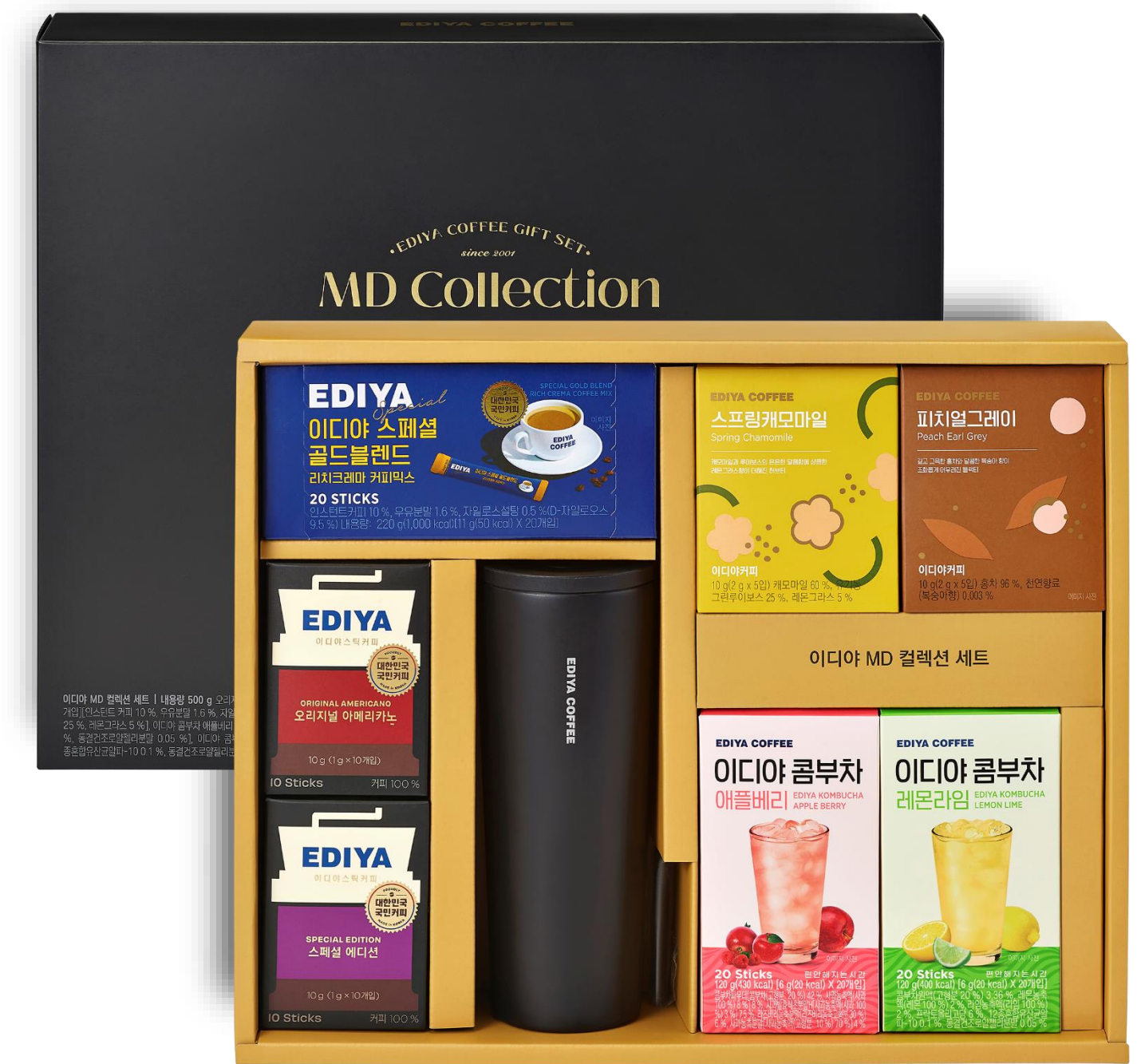
이디야MD컬렉션 세트 43,000

전통차(10T) 2종 액상 과일차(10T) 2종 커피박 텀블러(600ml) 1개