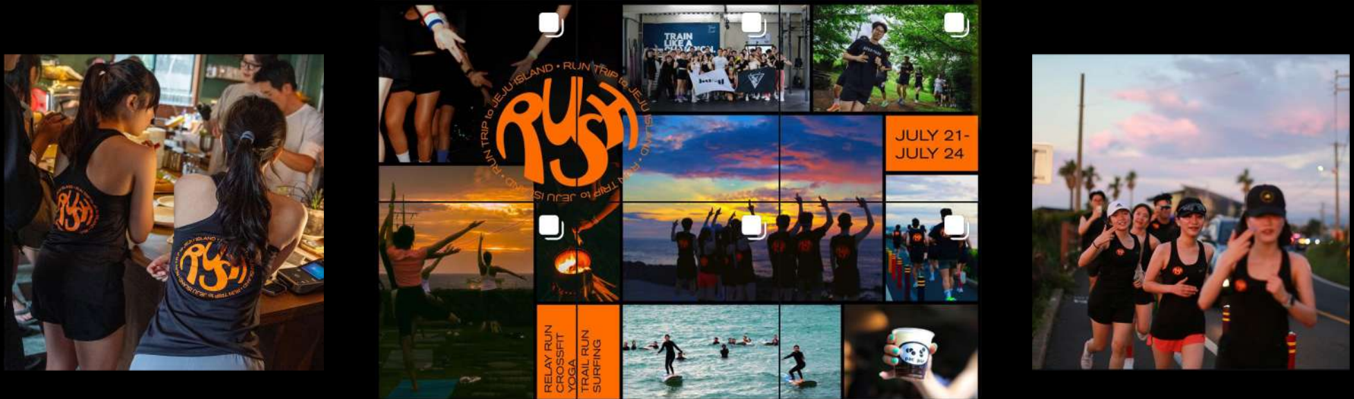
▲ 2023 제주 런트립 (인스타그램 @rush_runningcrew에 게시되어 있습니다.)

추가적 요청사항 (제품 단독 포스팅, 사용 장면 디렉팅) 이 있을 경우 명시해주시고, 검토 후 최대한 반영하는 방향으로 진행하겠습니다.