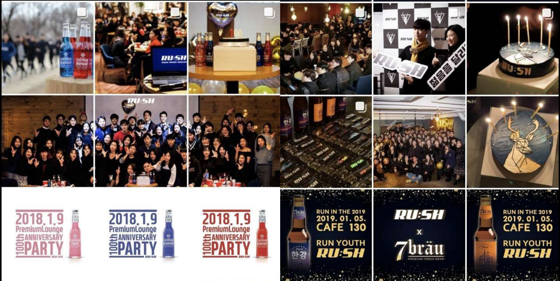
▲ 협찬 홍보 SNS 포스팅 예시