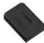
배터리 팩 LP-E12