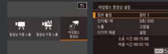
▶ 타임랩스 동영상 선택

4K로 촬영한 타임랩스 동영상을 경험해 보십시오. Full HD로는 미처 담아내지 못했던 멋진 도시의 풍경이나 자연의 섬세한 모습을 4K의 고해상 영상으로 감상할 수 있습니다. 타임랩스 동영상 전용 모드에서 쉽게 설정하고 촬영할 수 있습니다.