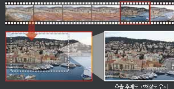
추출 후에도 고해상도 유지

*1 Full HD 영상은 프레임 추출이 불가능합니다. 동영상 프레임이 정지 이미지로 저장되기 때문에 일반 정지 이미지의 화질과 동일하지 않습니다.