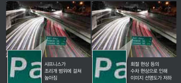
사프니스가 조리게 범위에 걸쳐 높아짐