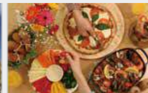
하이 앵글 촬영