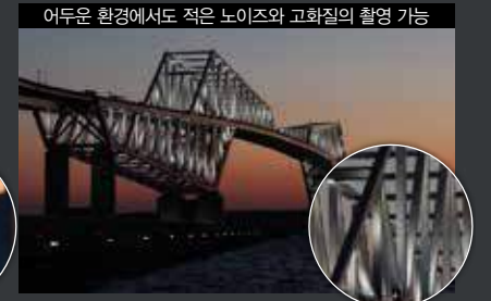
어두운 환경에서도 적은 노이즈와 고화질의 촬영 가능 야경처럼 어두운 장면에서도 아름다운 사진을 촬영할 수 있습니다. 영상 엔진의 처리 과정을 통해 노이즈를 억제하면서 섬세한 영역까지 충실하게 묘사합니다.