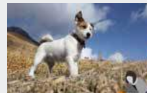
로우 앵글 촬영

EOS M50은 회전 각도를 자유자재로 바꿀 수 있는 LCD 모니터를 채용하여 세로 촬영, 하이 앵글 촬영, 반려동물의 눈높이에서 찍는 로우 앵글 촬영 등 다양한 각도에서 자유롭게 촬영할 수 있어 새롭고 다양한 영상 표현이 가능합니다.