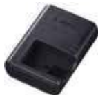
배터리 충전기 LC-E12(E)