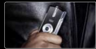
IXUS i 가