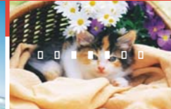
■ 7가지 AF 포인트 적용