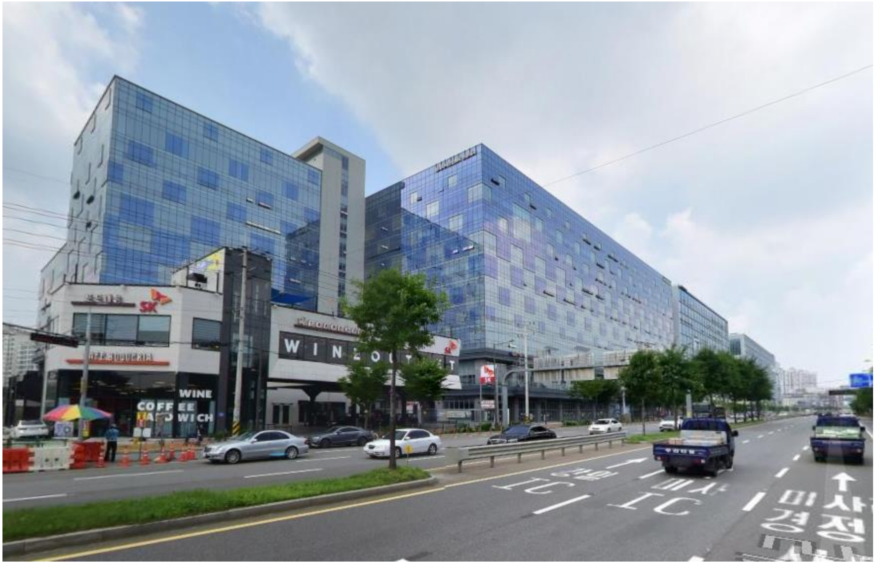
미사대로에서 본 현대지식산업센터