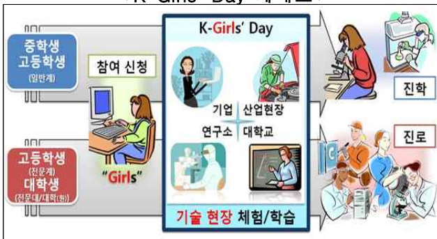
<K-Girls' Day 체계도 >