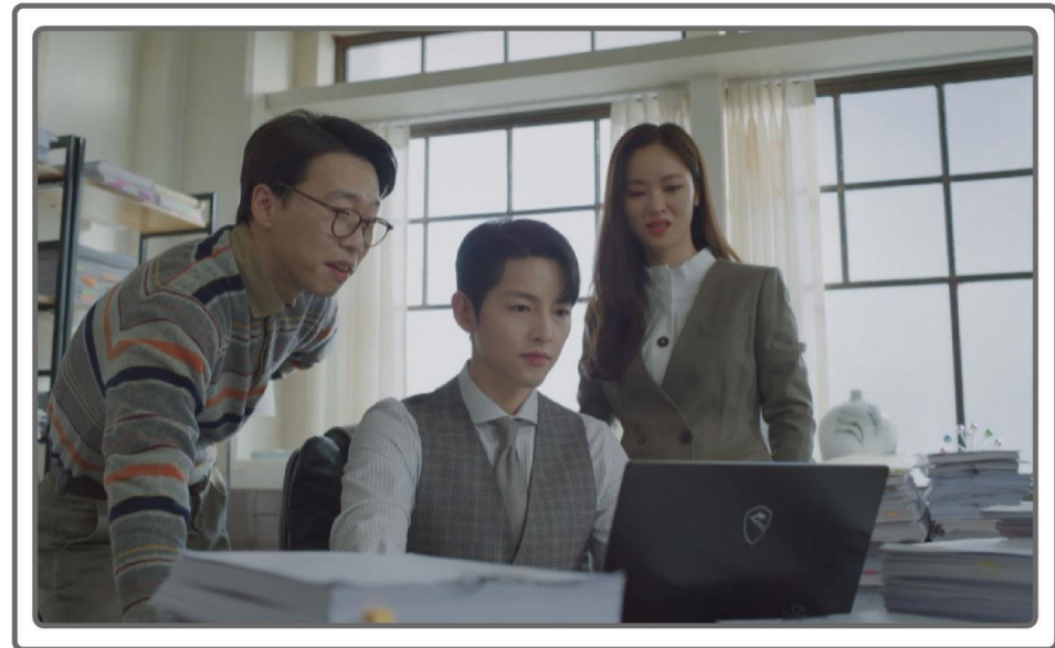
TVN “빈센조” 노트북 세팅 컷