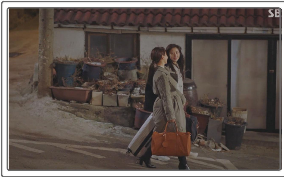
SBS “펜트하우스” 가방 연출 컷