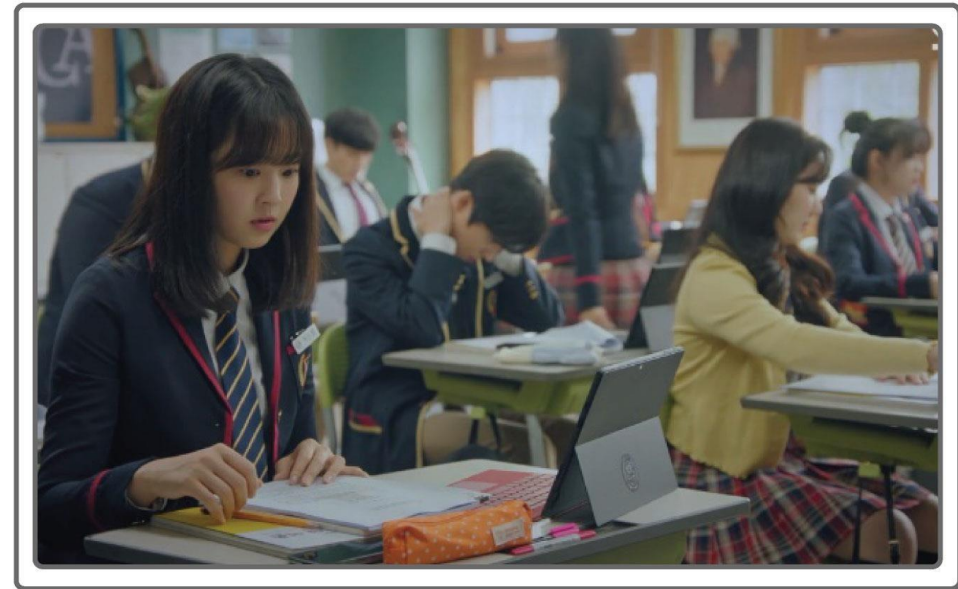
SBS “펜트하우스” 태블릿 세팅 컷