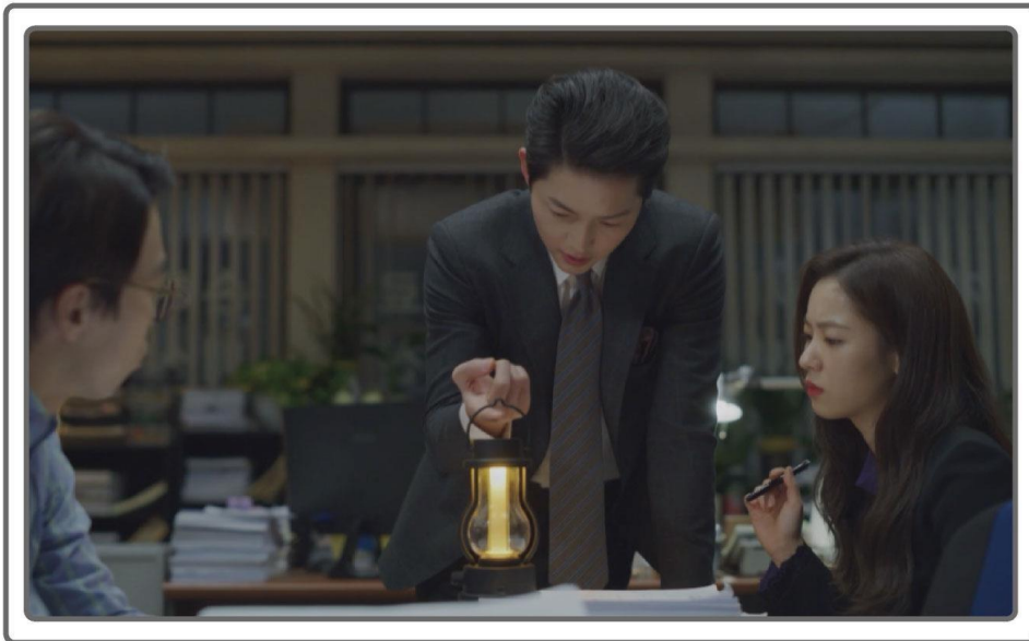
TVN “빈센조” 랜턴 연출 컷